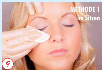
METHODE 1 im Sitzen

Wischen Sie verbliebene Farbreste jetzt mit feuchten Wattepaden mehrmals gründlich aus den Wimpern.