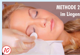
METHODE 2 im Liegen

Ziehen Sie danach das Hautschutzblättchen vorsichtig ab und wischen wieder feucht nach, bis alle Farbreste entfernt sind.